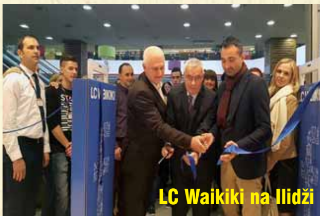
LC Waikiki na Ilidži

Na svečanom otvaranju je istaknuto da su sve radove izvodile domaće firme, a da je ugrađena oprema vrhunskih svjetskih proizvođača.