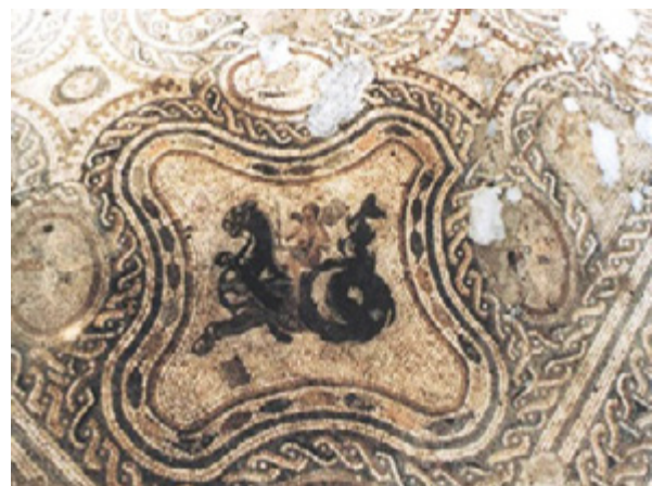
Mozaik sa likom Amora na morskome lavu, 3. st.